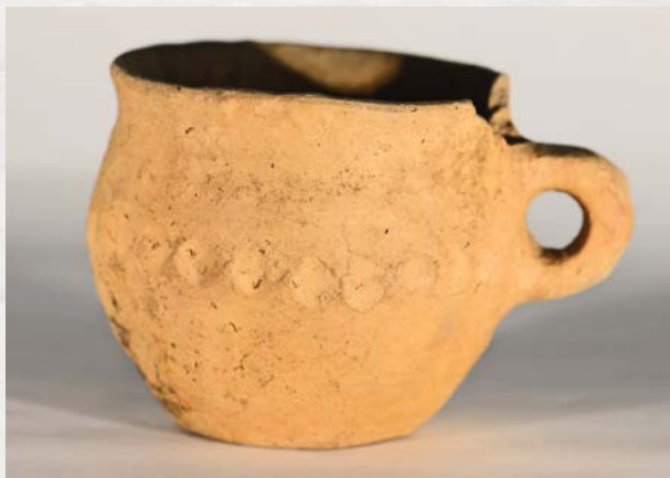
Kopje dat in een grafurn is gevonden. Vondst Taxandria Museum Turnhout

De focus ligt op het dorp dat op de Steenberg stond in de Romeinse periode. Het grootste dorp in de wijde omgeving. Opgebouwd met financiële steun van de Romeinse overheid. Een baanpost aan een kruispunt van wegen. Eén van vele dergelijke dorpen in de provincie Gallia Belgica, in het district 'civitas Tungrorum' met als hoofdstad van het district Tongeren.