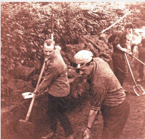
Opgravingen Steenberg.

Het Mercuriuspad blijft in de buurt van het huidige dorpscentrum en brengt je langs enkele vindplaatsen uit de bronstijd, de Romeinse tijd en de middeleeuwen, maar dit zijn lang niet de enige plaatsen waar sporen van de mens in het verleden zijn gevonden. Ook op andere plaatsen in Grobbendonk en de Kempen wonen, leven en rusten al meer dan 10.000 jaar mensen. Af en toe komen hun resten per toeval of bij onderzoek aan het licht.