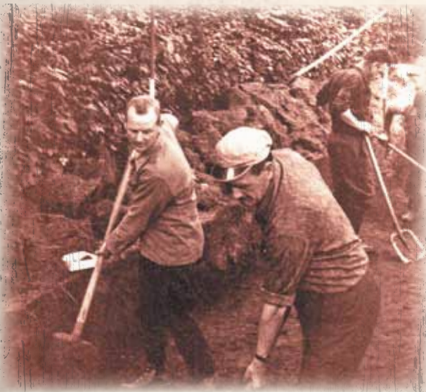
Opgavingen Steenberg. Foto geschonken door AVBC

Het Mercuriuspad blijft in de buurt van het huidige dorpscentrum en brengt je langs enkele vindplaatsen uit de bronstijd, de Romeinse tijd en de middeleeuwen, maar dit zijn lang niet de enige plaatsen waar sporen van de mens in het verleden zijn gevonden. Ook op andere plaatsen in Grobbendonk en de Kempen wonen, leven en rusten al meer dan 10 000 jaar mensen. Af en toe komen hun resten per toeval of bij onderzoek aan het licht.