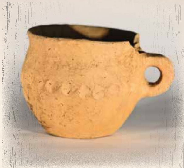
Kopje dat in een grafurn is gevonden. Vondst Taxandria Museum Turnhout, foto Dirk Segers

De focus ligt op het dorp dat op de Steenberg stond in de Romeinse periode. Het grootste dorp in de wijde omgeving. Opgebouwd met financiële steun van de Romeinse overheid. Een baanpost aan een kruispunt van wegen. Eén van vele dergelijke dorpen in de provincie Gallia Belgica, in het district 'civitas Tungrorum' met als hoofdstad van het district Tongeren.